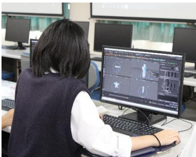
コンピュータグラフィックス