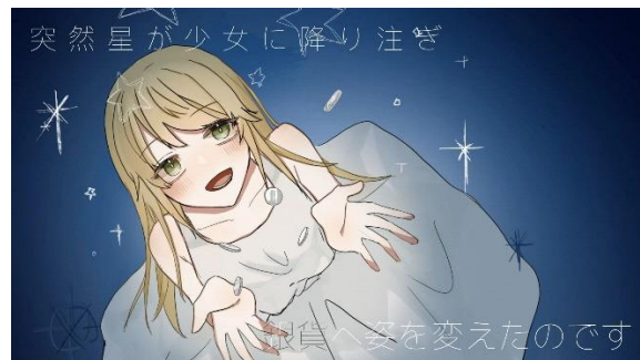
アニメーション制作（生徒作品）