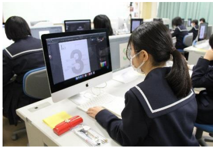
デジタルデザイン