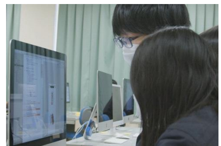
iPad アプリケーション開発