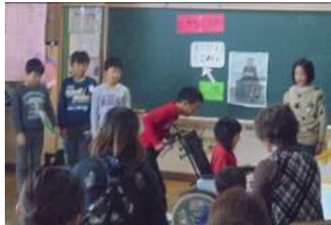
< 4年生 >