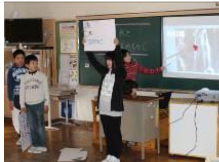
< 5年生 >