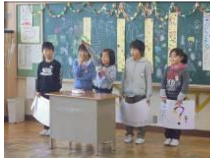
< 3年生 >