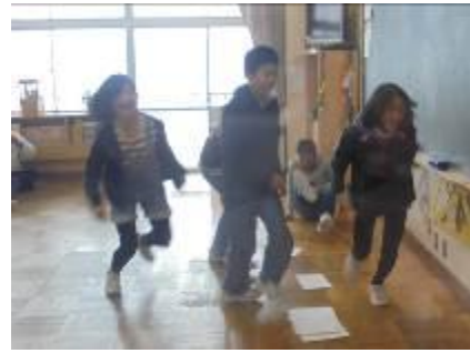
< 6年生 >