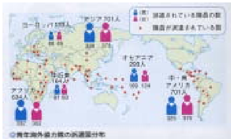
青年海外協力隊の派遣国分布