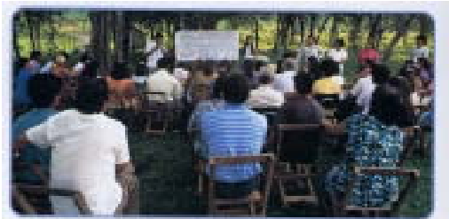
青年海外協力隊の人たちの活動