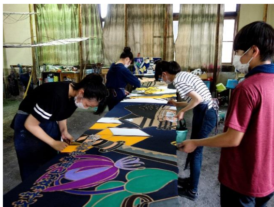
▲ 糊置き及び染付の体験実習（岐阜城北）