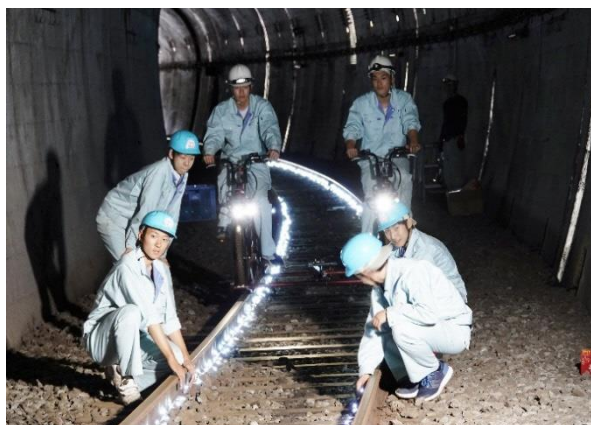
▲ レールメンテナンス トンネル内LED設置(飛騨神岡)