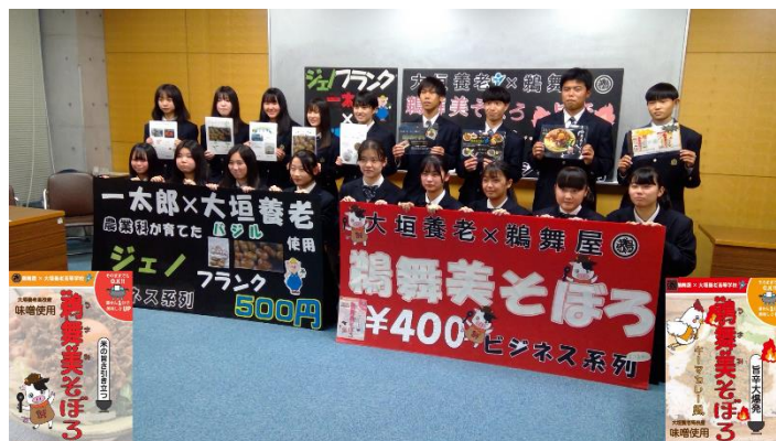
▲ 商品開発（大垣養老）