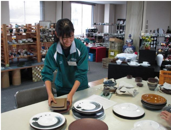
▲ 職場体験学習（土岐紅陵）