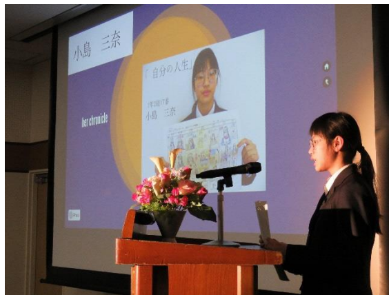
▲ ライフプラン発表会（岐阜総合）

総合学科では、各教科・「産業社会と人間」をはじめとしたキャリア教育の授業を通して自分史の作成、仲間とのグループワーク、インターンシップ実習、ライフプランの発表会などを経験します。こうした学習活動により、進路に対する自覚が深まり、一人一人が将来のビジョンを描けるようになります。