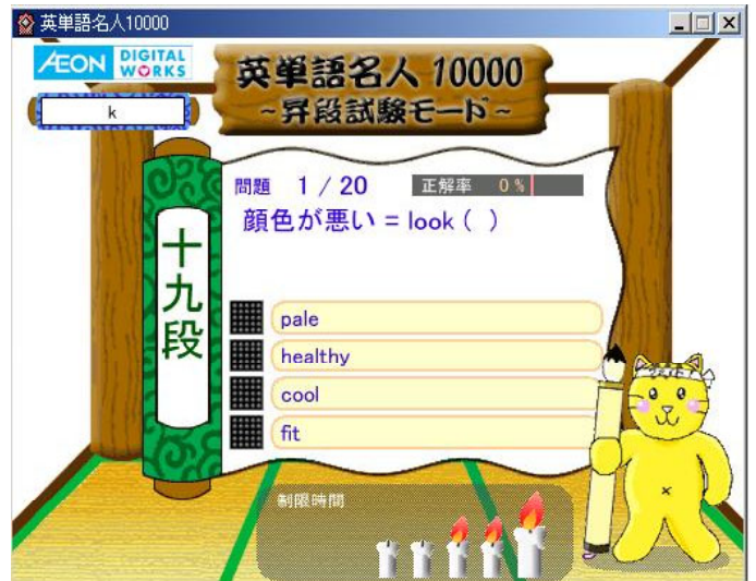
⑤ 昇段試験モード画面