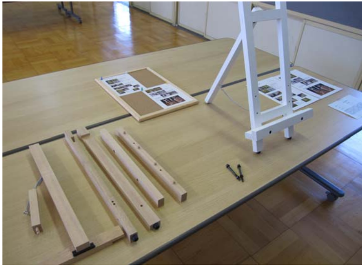
竹鼻中 河合教諭 イーゼル