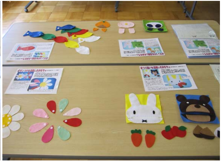
東長良中 岩田教諭 短時間で作れる幼児のおもちゃ