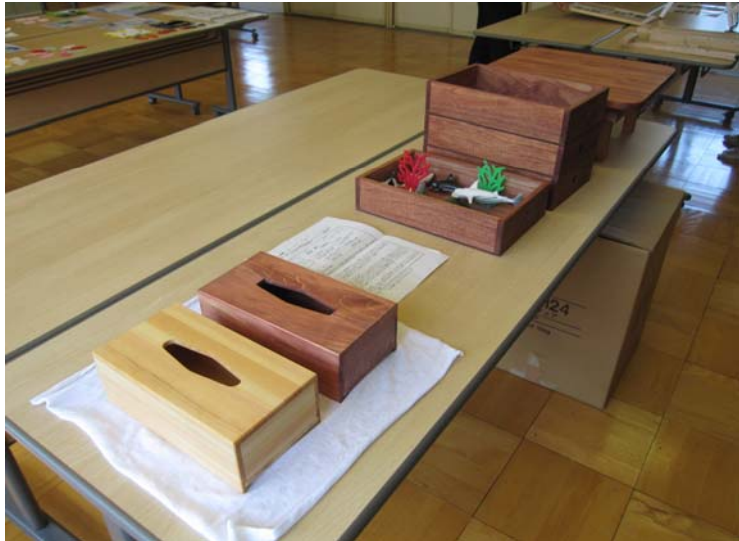
藍川北中 相宮教諭 日用品