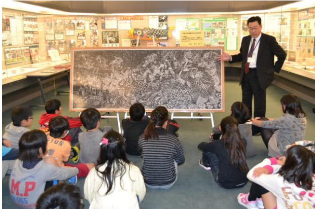
○県職員出前トークの講義を受ける児童