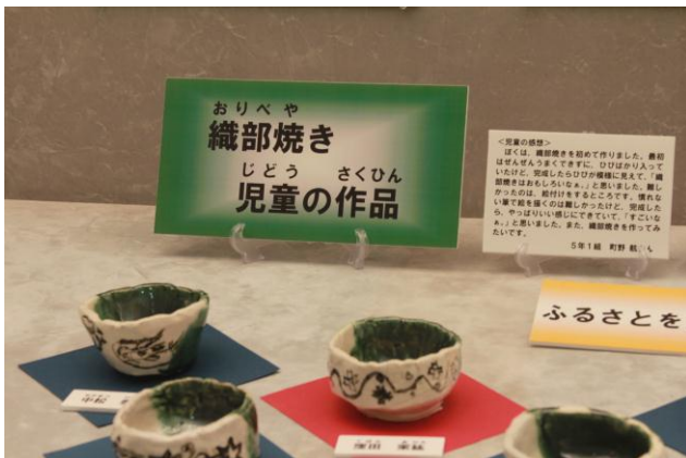
○児童による「織部焼」作品の展示