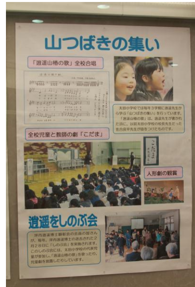
○坪内逍遥をしのぶ山つばきの集い