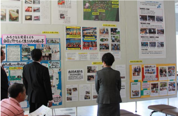
○受賞校の取組紹介展示を見る参観者