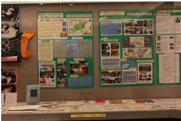
○第二次世界大戦中のリトアニア日本領事代理「杉原千畝」の生き方から学ぶ