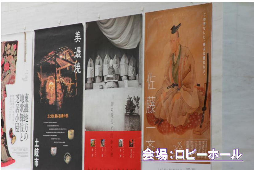
会場:ロビーホール