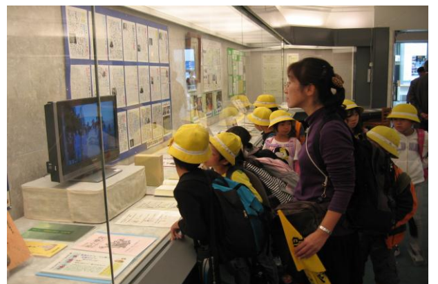
○「ふるさと紹介DVD」を観る児童