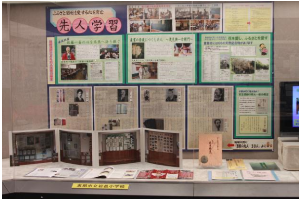
○ふるさと岩村を愛する心を育む先人学習