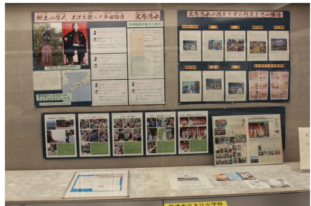
○薩摩義士「宝暦お手伝い普請」の顕彰の取組