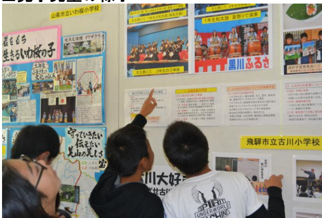
○表彰受賞校「太鼓の取組」を見る児童