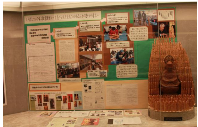
○「円空仏」と制作過程の様子